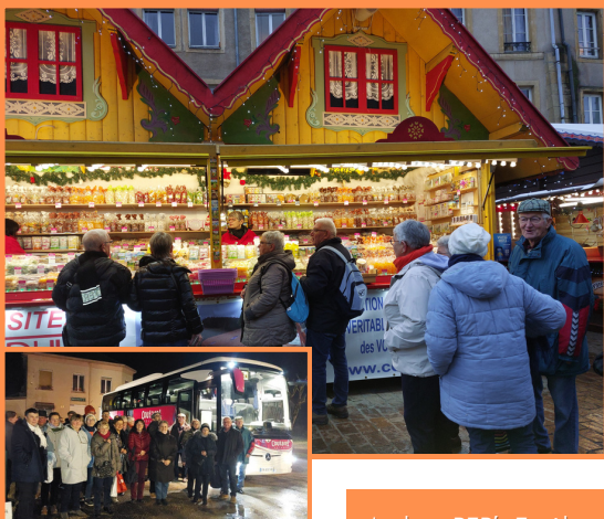
Marché de Noël à Metz