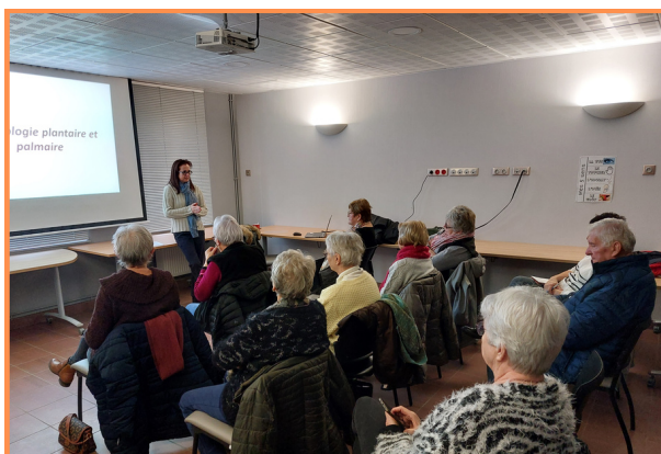
Conférence réflexologie plantaire