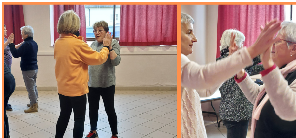
Danse / relaxation