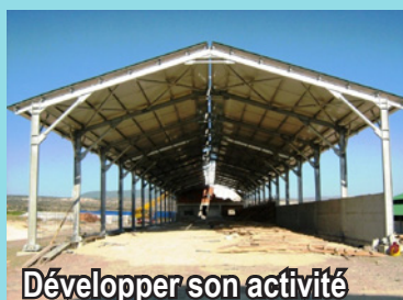
Développer son activité