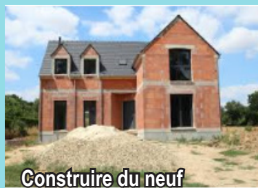
Construire du neuf