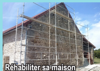
Réhabiliter sa maison

Une fois en place, il fixe, pour l'ensemble des 47 communes de la Communauté de Communes, les règles applicables à tout projet d'aménagement ou de construction (permis de construire, déclaration préalable, permis d'aménager...).