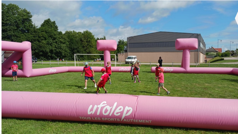
Journée organisée par l'UFOLEP et l'ACT Du 21 juillet 2025