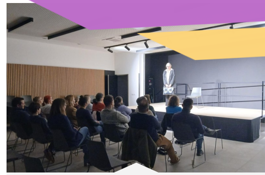
Spectacle « Autopsy des parents » du vendredi 17 octobre 2025