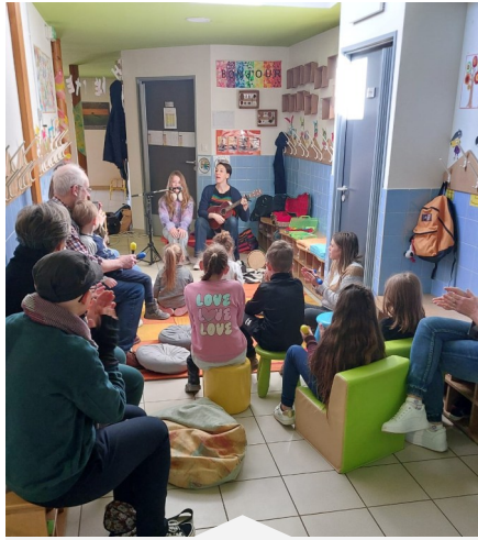
Jouer à tout âge organisée le 19 mars 2025