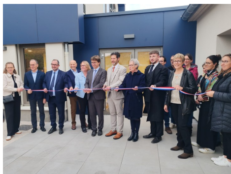
Inauguration le 17/10/2025