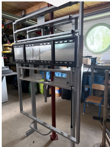
Modification des supports pour les nouveaux écrans numériques dans les écoles