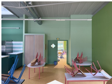
Création d'une cloison de séparation pour le réfectoire de l'école de Nubécourt