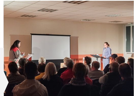
Spectacle « Champ contre champ » du 25 avril 2025