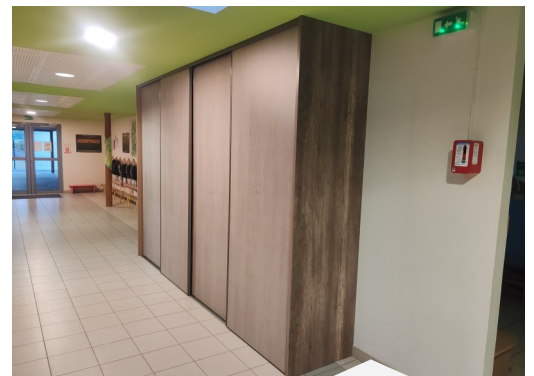
Création d'un placard à l'école de Pierrefitte sur Aire