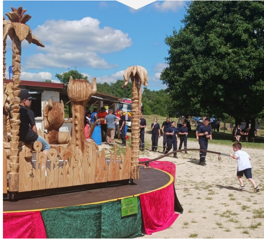
Faïtes du sport et de la culture organisée le 28 juin 2025