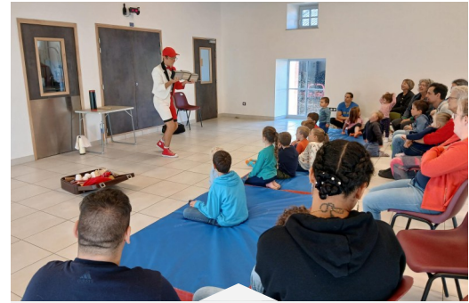
Atelier Parents-Enfants : Initiation cirque du samedi 04 octobre 2025